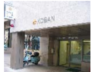
交番の左横にカルティエが入居している