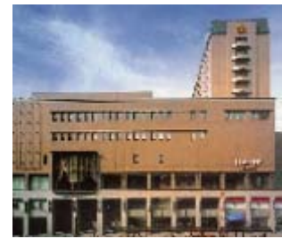
びぶれす熊日会館

先月の議会で、関西医科大学附属香里病院への補助金が議会で可決され、病院存続が決定しました。香里園駅東側の再開発において、最も大きな地権者が関西医科大学となります。(補助金を出す条件として再開発の組合に入ることも提示していました)香里園の再開発はやっと全ての地権者が決定をし(再開発に賛成・反対を含めて)、本格的に街づく